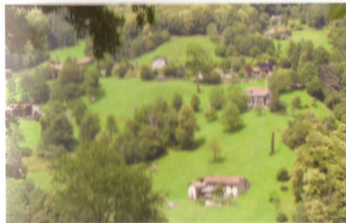
Pag. 40 La Peva vista da Bagneri