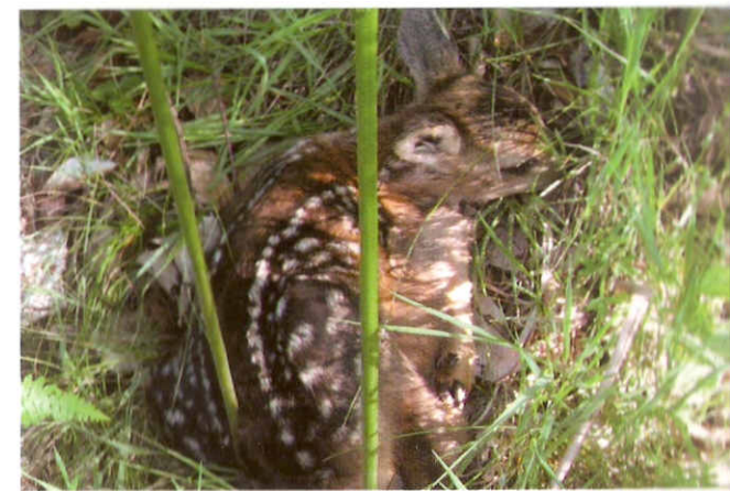
Cucciolo di cerviatto