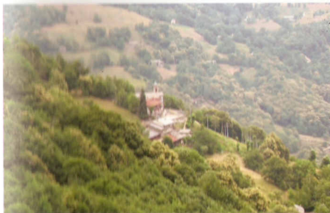
Pag. 31 Bagneri