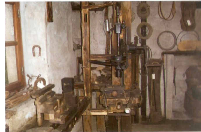
Pag. 31 Ecomuseo di Bagneri: la falegnameria