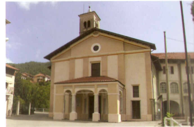
Pag. 86 Chiesa di Viera