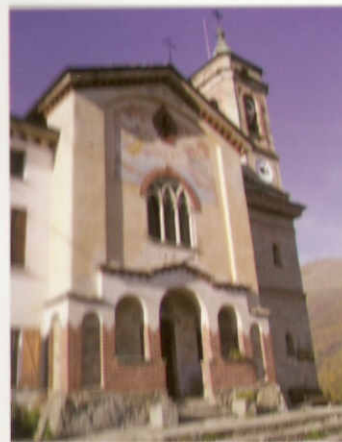
Pag. 31 Chiesa di Bagneri