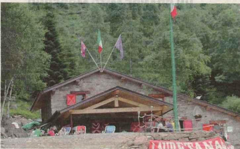
Un'immagine del rifugio appena rinnovato, punto di partenza per escursioni in alta valle Elvo

GRAGLIA Il 15 giugno scorso è stato inaugurato un nuovo rifugio, voluto e realizzato dal gruppo degli alpini di Graglia. La costruzione sorge al posto di baite diroccate sull'alpe Pianetti di proprietà del comune di Graglia, e tra vent'anni diventerà, anch'essa, di proprietà comunale. Situato a 1.341 metri s.l.m. è un'ottima meta per brevi passeggiate, partendo da Graglia o dal Tracciolino e una buona base di partenza per escursioni più impegnative verso il Mombaronè e gli alpeggi dell'Alta Valle Elvo. Al momento le camere da notte non sono ancora pronte, mentre la cucina è operativa. Nel mese di luglio il rifugio è aperto il mercoledì, venerdì, sabato e domenica. In agosto sarà attivo tutti i giorni. Info: tel. 347-1210675.