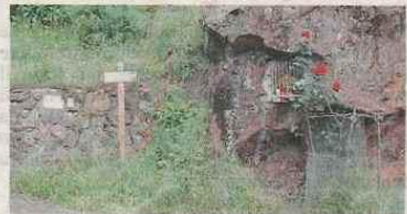
I pascoli delle Salvine a sinistra, le ampie faggete che si attraversano lungo il percorso e l'edicola di San Pietro

"Alpe Pianetti" gestito dagli alpini di Graglia. Questo ex alpeggio si trova a 1.341 metri di altitudine sul mare per cui siamo saliti per quasi 400